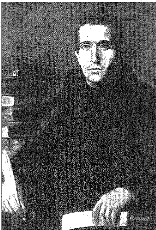
El pensador catalán tuvo una sólida idea de España.